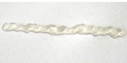
Gel incolor não mancha as superfícies.

LOCAIS DE APLICAÇÃO: Cozinhas industriais e domésticas, frigoríficos, laticínios, fábricas de bebidas, fábricas de rações, docerias, padarias, bares, restaurantes, hospitais, hotéis, veículos de transporte coletivo, aeronaves entre outros.